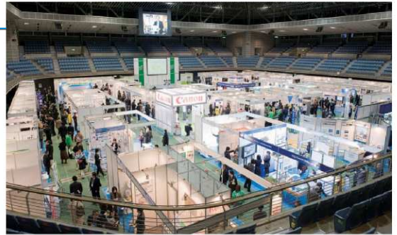
*平成22年12月現在。都合により予告なく変更になる場合があります。

この技術展では、川崎市のこれまでの環境への取組みや、企業における地球温暖化防止、省エネルギー・自然エネルギー、プラスチック・古紙リサイクル、水処理・大気浄化などの技術・製品、また企業経営における環境配慮の取組み事例など、幅広い環境分野の技術・製品・ノウハウの展示を行います。